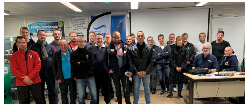
Evolution recyclage TIV CODEP 67.