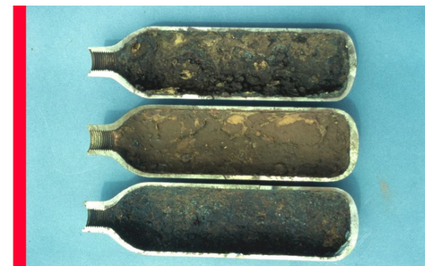
Corrosion généralisée dans des bouteilles de gilets de stabilisation, ayant contenu de l'eau de mer